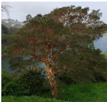
Arrayan – Luma apiculata

Es un arbusto de ramas espinosas, que puede alcanzar los 2 metros de altura. Se caracteriza por su abundante floración en octubre y noviembre. Se adapta bien en sombra y semisombra, y requiere de suelos bien drenados, adaptándose muy bien en laderas.