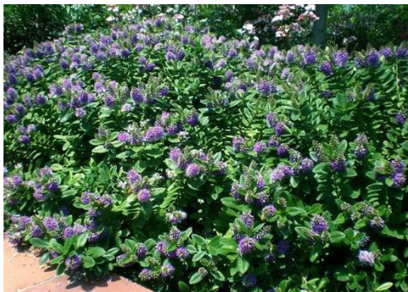
Veronica compacta – Hebe buxifolia

Crece en lugares húmedos, cerca de cursos de agua o vertientes. Árbol siempreverde de copa globosa y ramas erectas, de 6 a 10m de altura y 6m de diámetro de copa. Necesita suelos húmedos, y prefiere la semisombra. Crece bien a pleno sol cuando cuenta con suficiente humedad.