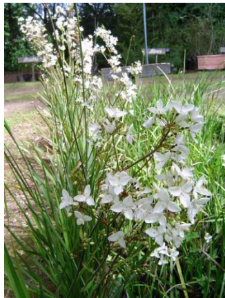
Calle calle – Libertia chilensis

Es un arbusto rastrero, de hojas perennes, y de flores pequeñas pero muy llamativas. En buenas condiciones llega a 0.3 metros de alto. Resiste muy bien las heladas y muy bajas temperaturas, se adapta bien en sol o sombra. Requiere de un riego intermedio y bien drenado.