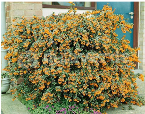
Michay – Berberis darwinii

Es un arbusto de ramas espinosas, que puede alcanzar los 2 metros de altura. Se caracteriza por su abundante floración en octubre y noviembre. Se adapta bien en sombra y semisombra, y requiere de suelos bien drenados, adaptándose muy bien en laderas.