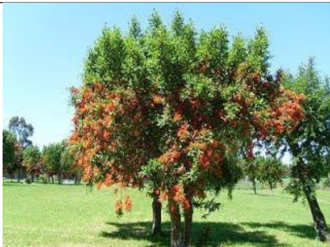
Notro - Embothrium coccineum

Es un árbol nativo que crece principalmente en los bosques templados australes de Sudamérica. Tiene una flor de color rojo escarlata. Su crecimiento es rápido y puede llegar a medir 15 metros de altura. Resiste bajas temperaturas.