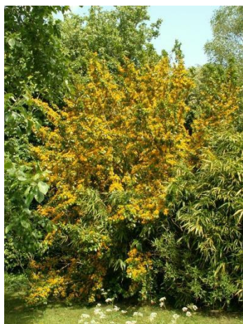
Corcolen – Azara serrata

Es un árbol pequeño y perenne, que puede llegar a medir entre 10 a 15 metros de altura. Su floración es en verano. Se adapta bien en sol o sombra, con suelo húmedos, ideal para contener laderas.