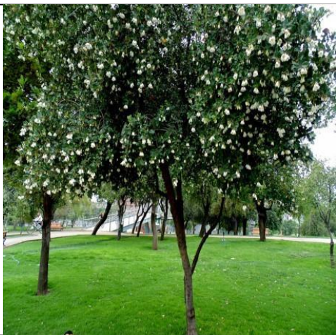
Patagua - Crinodendron patagua

Es un árbol nativo que crece principalmente en los bosques templados australes de Sudamérica. Tiene una flor de color rojo escarlata. Su crecimiento es rápido y puede llegar a medir 15 metros de altura. Resiste bajas temperaturas.