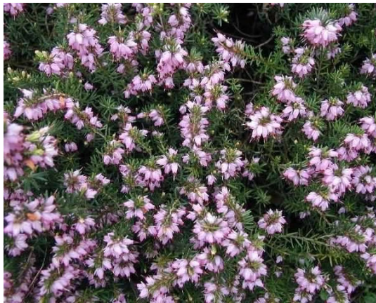
Erica – Erica carnea

Es un arbusto que puede alcanzar una altura de 1,5 metros. Es de tipo perenne, con forma oval, de considerable grosor y de un hermoso color verde claro brillante. Tiene su época de floración en temporada de otoño, flores de color blanco crema. Requiere un riego intermedio, dándole mayor atención en la época de calores fuertes. Tiene resistencia a heladas de hasta -5° C. Se adapta a lugares con sol o sombra.